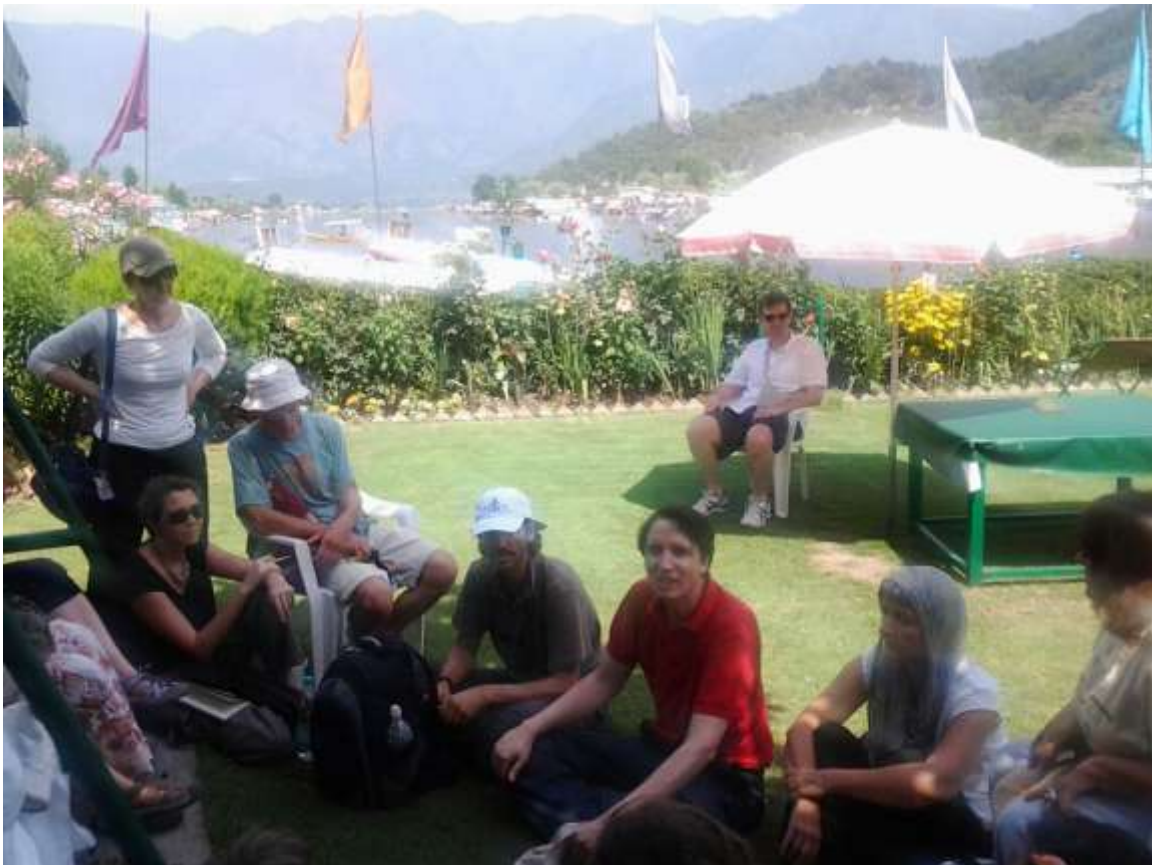
« House boat » Shrinagar, Casa-barca, Péniche hotel - Bernardo...