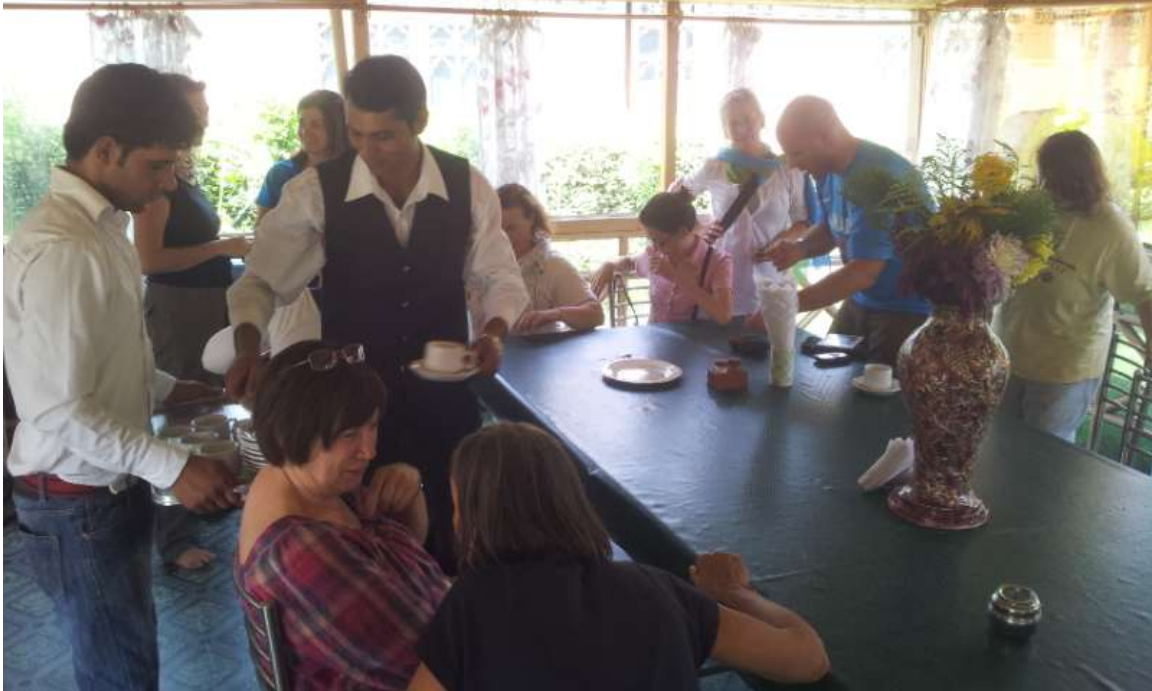
Hotel Resort Shrinagar